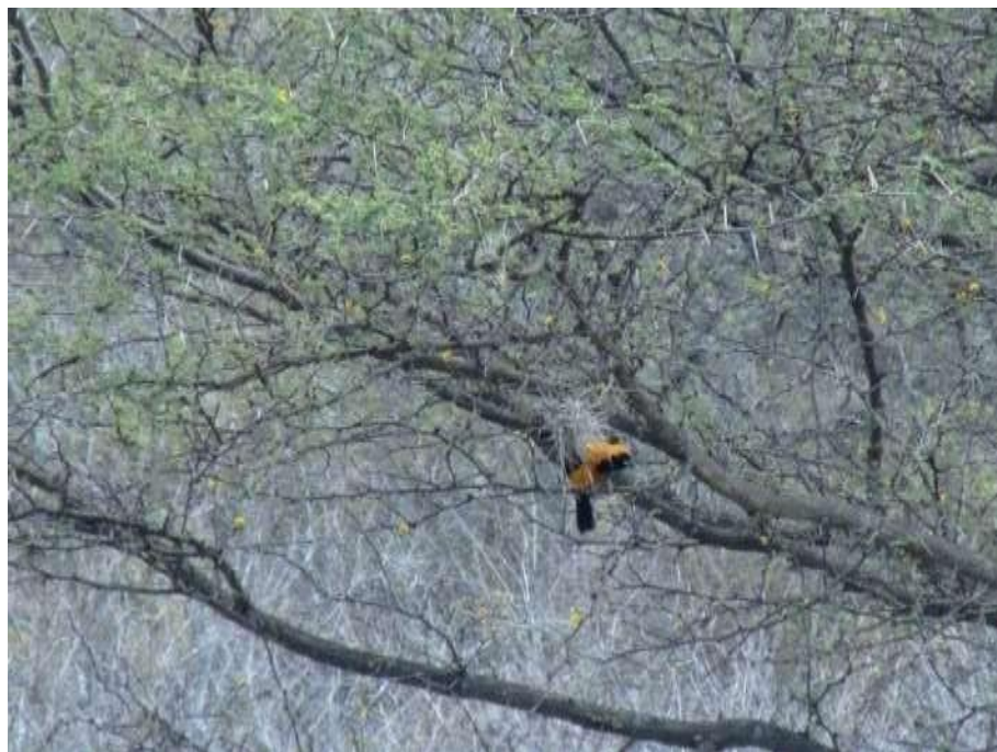
Figura 2. Pájaro Toche amarillo en la vereda Tochupa-cuarto naranjaos.