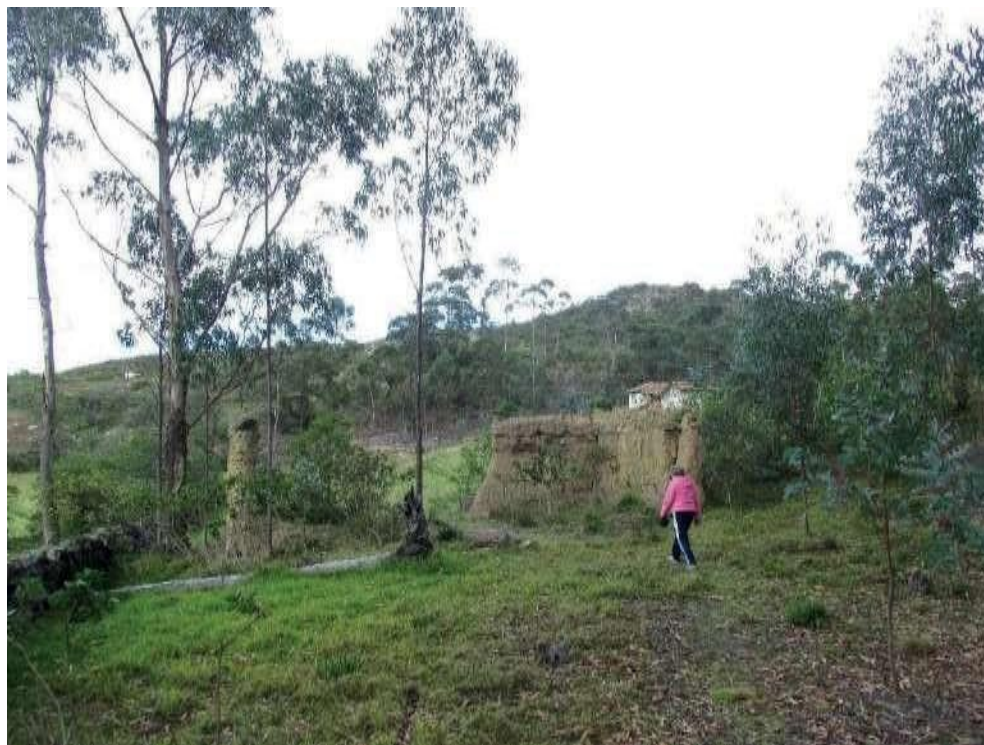
Figura 5. El campesino envejecido junto con su territorio.