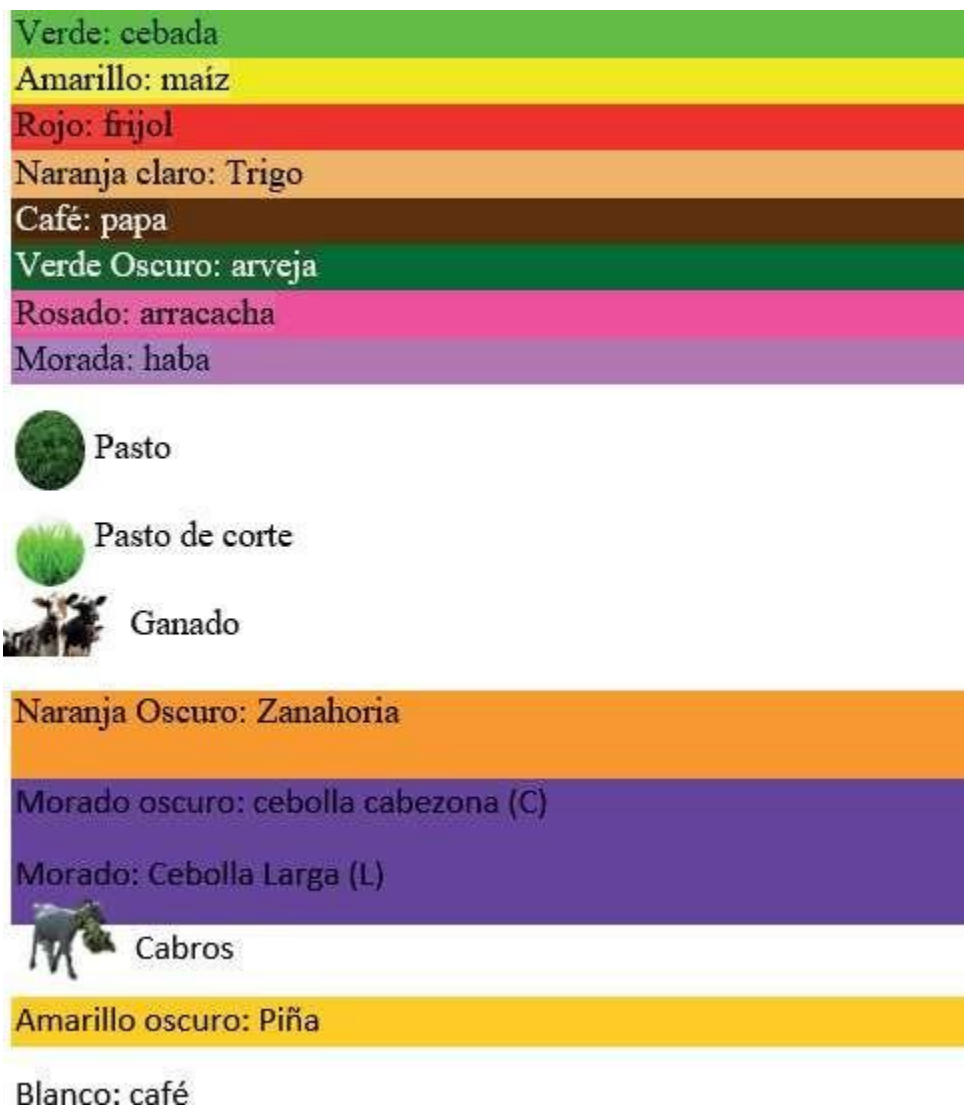
Figura 6. Indicativos Cartografía Social

Nota: Los indicadores mencionan los alimentos y animales que producían y comercializaban los campesinos, clasificándolos por colores e imágenes.