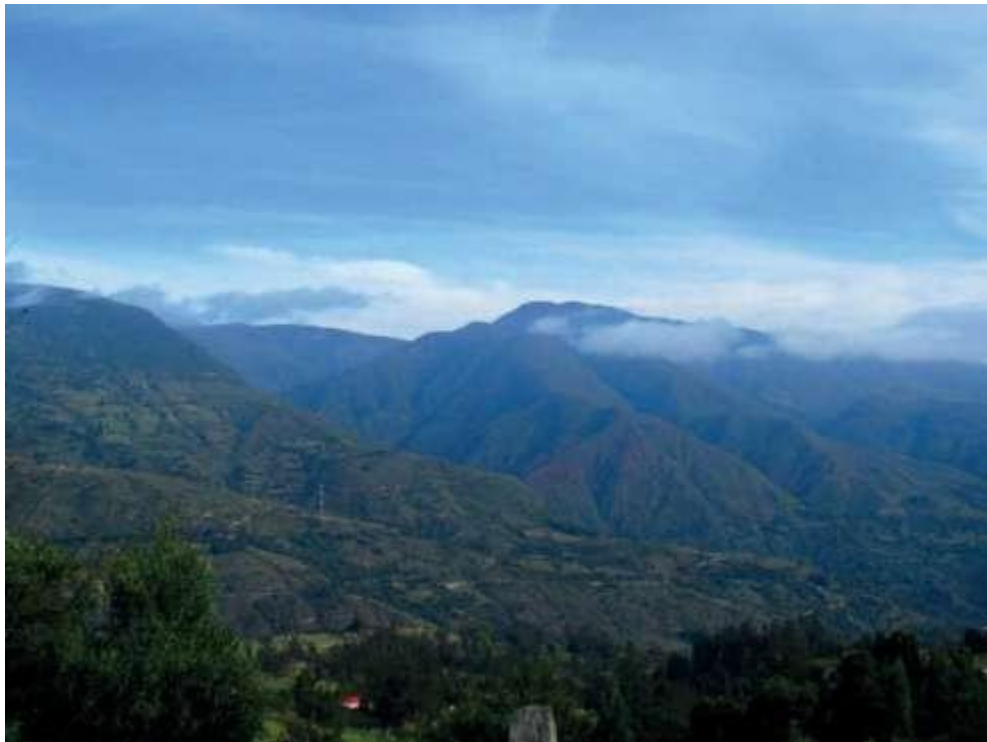
Figura 3. Paisaje de montañas vereda del Hato