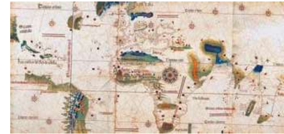
Figura 3. El mapa muestra la división territorial, entre la corona española y la corona portuguesa, después de la firma del tratado de Tordesillas.

del Reino de Castilla, es en este punto donde aparece la iglesia católica, otro de los actores importantes en los procesos de colonización y conquista, la cual cuenta con gran influencia en lo que respecta a las relaciones políticas que se dan en el panorama europeo de la época, si se considera que este suceso ocurre, en el momento en el cual se está dando la transición del antiguo sistema feudal, al surgimiento de un nuevo sistema sociopolítico, es de entender que se haya recurrido al juicio papal para realizar la asignación de los nuevos territorios, para lo cual. "El papa Alejandro VI, En la Inter Caeteras, disponía que las nuevas tierras descubiertas por Cristóbal Colón fueran otorgadas a el Reino de Castilla, determinación que no fue bien aceptada por la corona portuguesa." (Ayuntamiento de Tordesillas, 2018) Posteriormente y después de una serie de negociaciones llevadas a cabo por las dos coronas, el 7 de junio de 1494, se realiza la firma de un tratado en Tordesillas, que llevara el mismo nombre, mediante el cual se dispone de nuevos lineamientos diferentes a los establecidos en la encíclica del papa Alejandro VI los cuales se