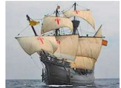
Figura 5. Carabela con velas cuadradas, Las carabelas fueron reemplazadas por los galeones

Por tal motivo esta crítica la hacemos basados en las cifras que se nos deja el genocidio que recibió el suceso conocido como el "descubrimiento de América", el nombre que se le otorga de entrada, no sería fiel a la historia y a la realidad vivida por los pobladores del nuevo mundo, ya nos parece que no refleja la verdad sobre los acontecimientos que tuvieron lugar durante el periodo de colonización y conquista del continente americano, puesto que ignora parte de la historia, y como en todos los enfrentamientos, en los cuales la violencia es el factor predominante, solo se cuenta la versión del ganador, y se desconoce por completo la de quienes no salen bien librados de estas situaciones, para el caso particular de este escrito, no podemos desconocer que los pobladores aborígenes del territorio americano, son quienes no pudieron contar su versión de la historia.