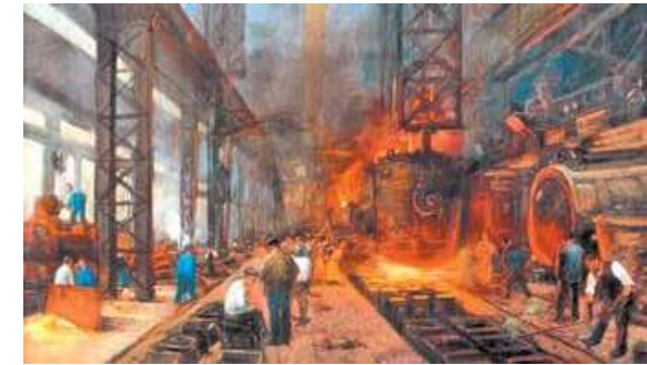
Figura 4. Las fábricas eran las nuevas granjas para los campesinos, imagen de las fábricas durante la revolución industrial.

"Por las faldas de esta cordillera se han hallado grandes mineros de oro y plata... y en todo el reino del Perú; si hubiese quien lo sacase, hay oro y plata para sacar por siempre jamás; porque en las sierras los llanos y los ríos, y en todas partes que caven y busquen hallaran plata y oro" (Cieza de León, 1553)