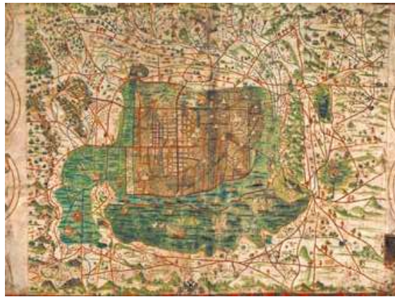
Figura 6. El mapa representa la ciudad de México- Tenochtitlan y sus contornos hacia 1550

Se puede interpretar que todo este impulso económico, que llegaba sin ningún costo más que le dé proporcional el arsenal de guerra y de utilería para los viajes, estaba en un desequilibrio en relación a las dimensiones de ganancias que estaban consiguiendo casi de manera gratuita, llevando a que las sociedades en Europa pudieran tener un desarrollo bastante mayor al que estaban sometidos en América, perjudicando el linaje, la cultura y otros aspectos de valor indispensable a nivel humano, de manera que si bien el avance tecnológico con el cual les fue posible dominar las civilizaciones americanas, es un punto de gran importancia al realizar comparaciones sobre los distintos grados