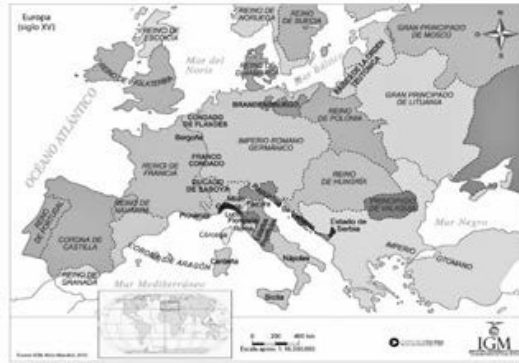
Figura 1. Mapa de la división territorial del continente europeo durante el siglo XV.

En el año de 1492, Cristóbal Colón, toca puerto, en el continente americano, en la isla de Guanábana, actual isla de san salvador, posteriormente cuba, y a la isla de la española, actualmente comprendida por Haití y república dominicana, encomendado por los reyes católicos, Isabel de Castilla y Fernando de Aragón, en busca de nuevas posibilidades que les permitiesen acceder a los territorios de la india, a fin de establecer nuevas rutas comerciales, gracias a las nuevas condiciones económicas que se empiezan a desarrollarse en el continente europeo, producto de los fenómenos de unificación territorial de los hasta entonces reinos europeos, que se configuraban bajo un sistema socioeconómico feudal, el cual anteriormente, habría propiciado, la división territorial en gran cantidad de feudos, con la finalidad de salvaguardar los reinos, ante las constantes invasiones bárbaras, lo que genero el deterioro del comercio, la primacía de las actividades agrícolas y el autoconsumo de los productos, por la obligación que los vasallos tenían