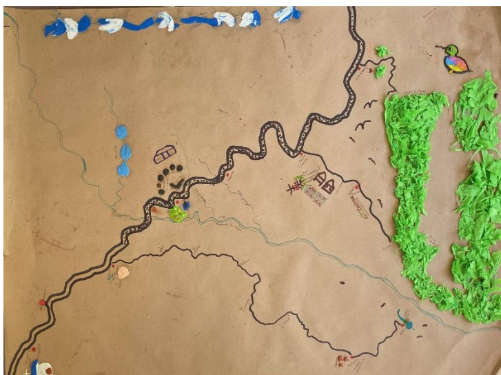
Mapa 1: relación de la comunidad con su territorio.

El subgrupo de participantes del taller que elaboró este mapa, resaltaron los lugares de especial